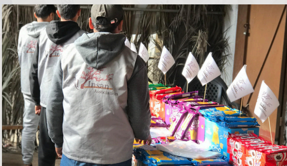
Préparation de colis alimentaire - Gaza