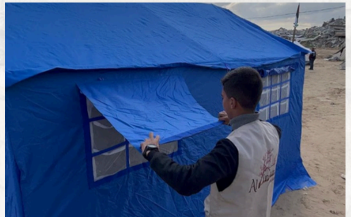
Une tente montée et prête à accueillir - Gaza