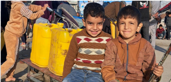
Des enfants lors d'une distribution d'eau - Gaza

Distribution quotidienne d'eau claire en Syrie et en Palestine