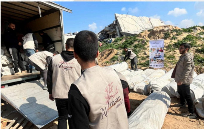
Mise en place des tentes - Gaza