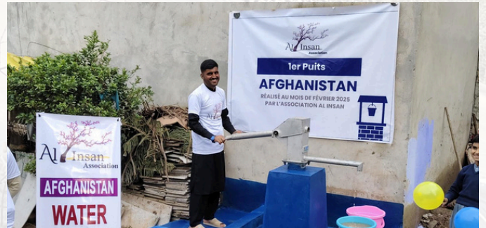
Inauguration de notre premier puits en Afghanistan