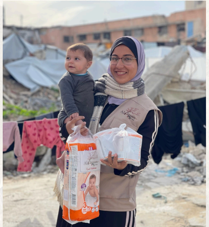
Distributions de couches et de laits pour les nourrissons - Gaza