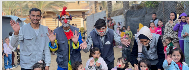
Activités pour les enfants - Gaza